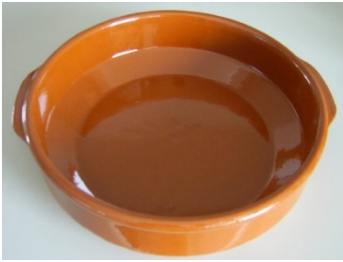
Schale Ab 8 Cm.