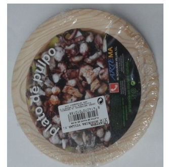
Holzteller Plato de Pulpo