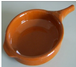
Pfanne Ab 14 Cm.