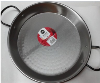
Paelleras Pulidas Ab 2 Pers.