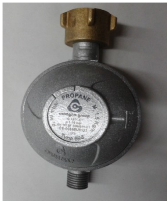
Gas Regler (1,5 Kg)