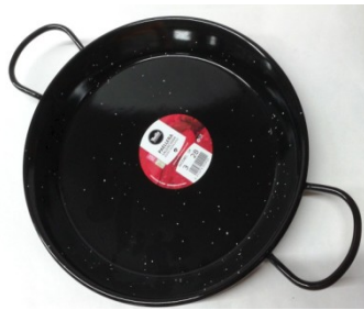
Paelleras Esmaltadas Ab 2 Pers.