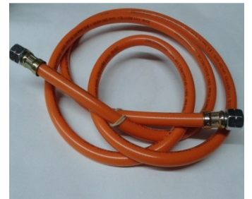
Schlauch 2,0 m.