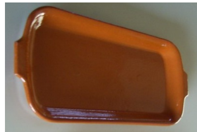
Bandeja Rectangular Plana ab 18x13 Cm