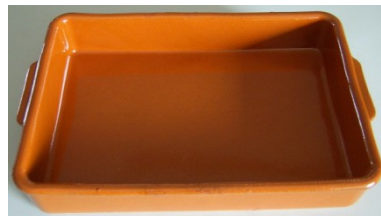
Bandeja Rectangular Ab 27x18 Cm